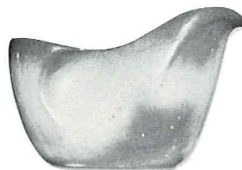
4A—8 OZ. CREAMER—1.50