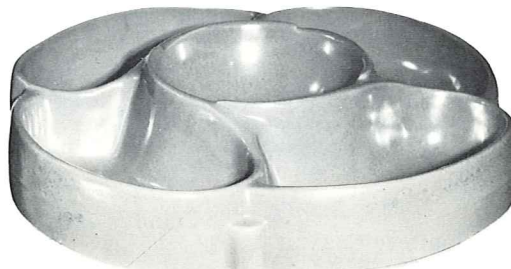
*818—5 SECTION LAZY SUZETTE ON BALL BEARING BASE—12"—7.50