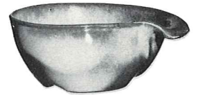
*4X—16 OZ. CEREAL—1.50