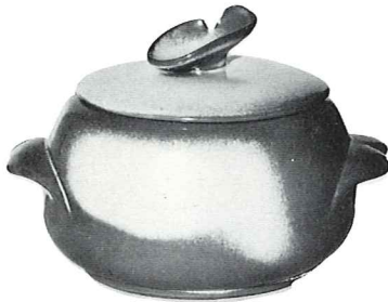
*4V—2 QT. BAKER—4.50