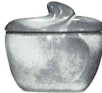
4B—SUGAR WITH LID—2.00