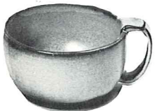
*4SC—11 OZ. SOUP CUP—1.50