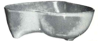
4N—24 OZ. VEGETABLE—1.50