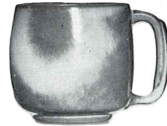
4M—18 OZ. MUG—1.60