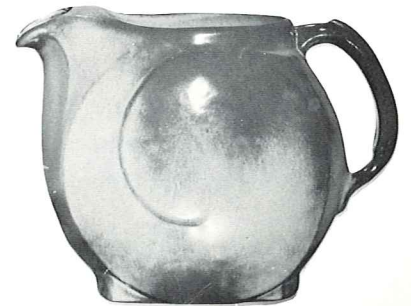
*4D—2 QT. PITCHER—4.00