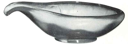
*214—12" SERVICE BOWL—2.50