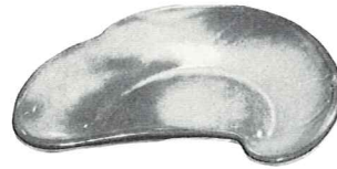
4S—6½" BONE DISH—1.25