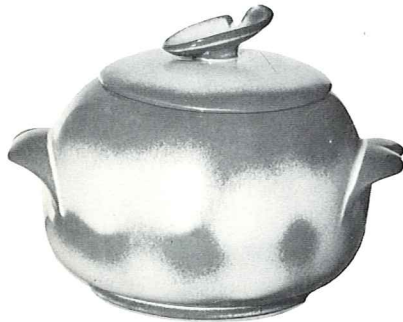
*4W—3 QT. BAKER—6.00