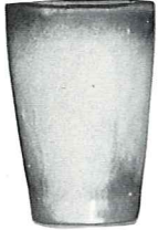
*5L—12 OZ. TUMBLER—1.20