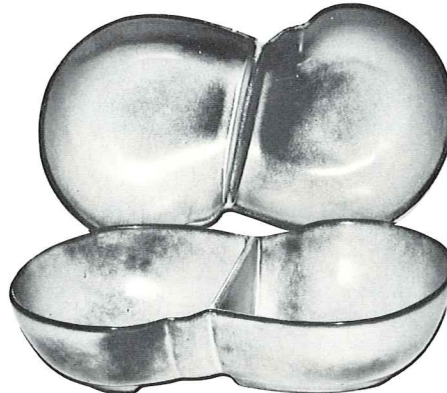
4QD—11" DIVIDED BOWL—3.50