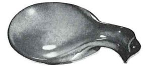
*4Y—6" SPOON HOLDER—1.00